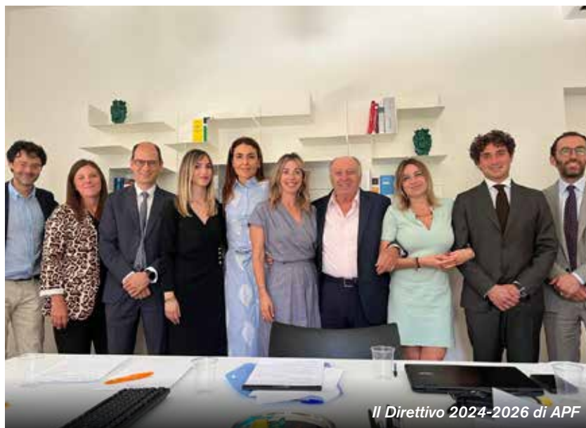
Il Direttivo 2024-2026 di APF

la giustizia, anche a livello locale, e di intercettare le esigenze dell'intera classe forense, affinché l'avvocatura continui ad essere un interlocutore fondamentale per il corretto esercizio della giurisdizione.