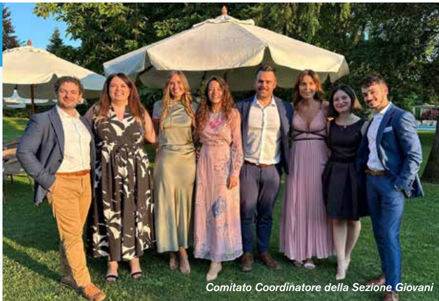
Comitato Coordinatore della Sezione Giovani